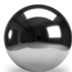
Acero Inoxidable Tipo 304 y 316